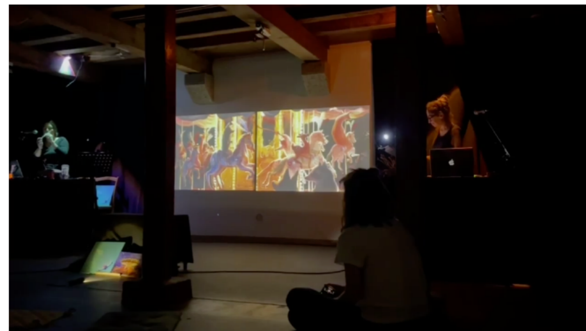
extrait des premières représentations - juin 2022 - Calvi